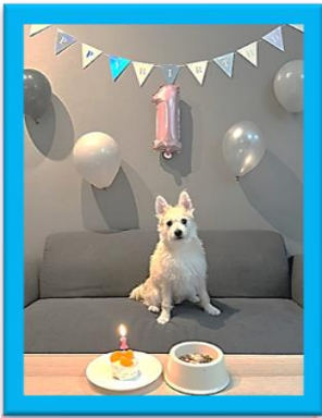
琥太郎くん(シュナボメ)

1歳のお誕生日 はじめてのササミ入りごはん と手作りケーキ キョトン顔のハンサムくん♥