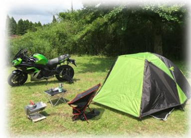
バイクでソロキャン!!ワイルドな面も。