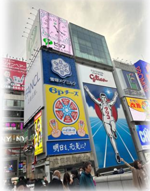
大阪といえばやっぱりグリコ?!