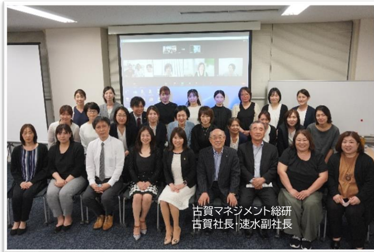
古賀マネジメント総研 古賀社長+速水副社長

新しい仲間も加わり、より活気溢れる下半期報告会となりました。 各事業所の管理者の皆さんの熱い気持ちとブランチェスグループの皆さんの 団結力が感じられる貴重な報告会となりました。