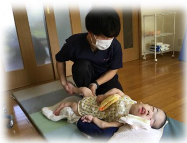
自作のお弁当を持参! アウトドア派の優しいリハビリ先生♪

楽しむことが大好きだからこそ、子ども達にたくさんの『楽しい』を 伝えられているんですね♪笑顔あふれる楽しいインタビューとなりました。