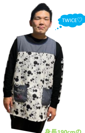
身長190cmのお兄ちゃん先生♪